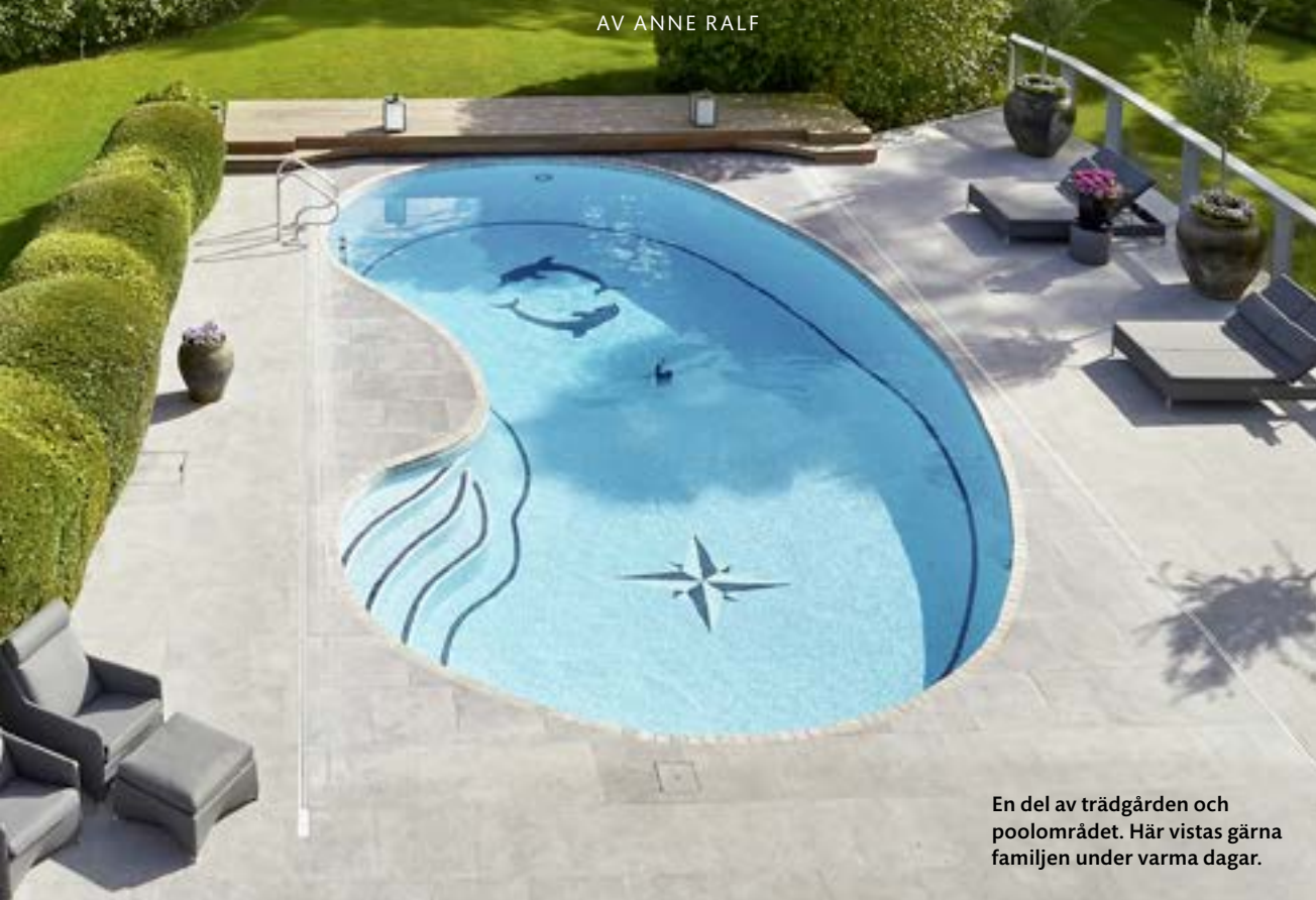
En del av trädgården och poolområdet. Här vistas gärna familjen under varma dagar.