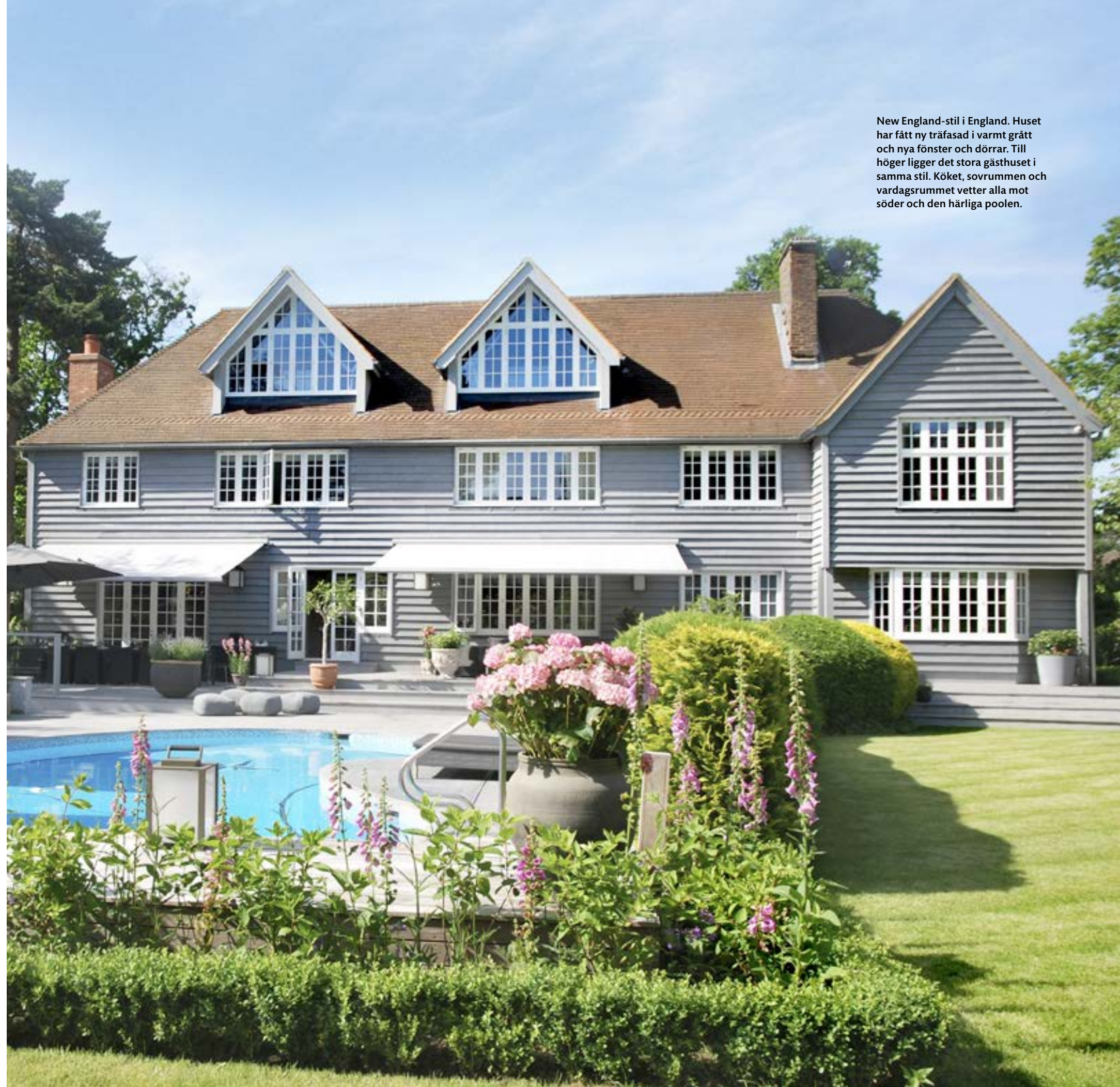
New England-stil i England. Huset har fått ny träfasad i varmt grått och nya fönster och dörrar. Till höger ligger det stora gästhuset i samma stil. Köket, sovrummen och vardagsrummet vetter alla mot söder och den härliga poolen.